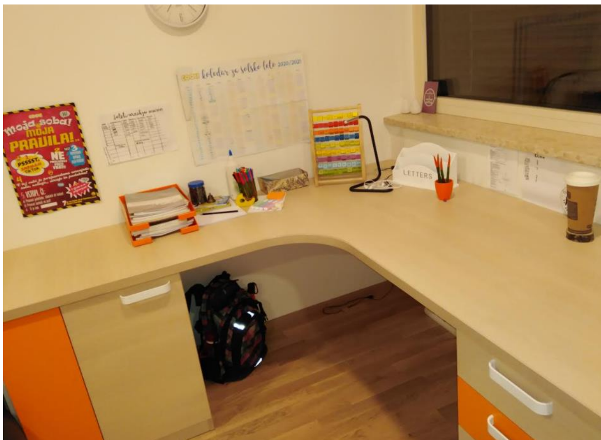
Pisalna mize Neže, učenke 6. razreda OŠ Petrovče

Nad mizo je ura, da se lahko dobro orientiraš in pravi čas vključiš k pouku.